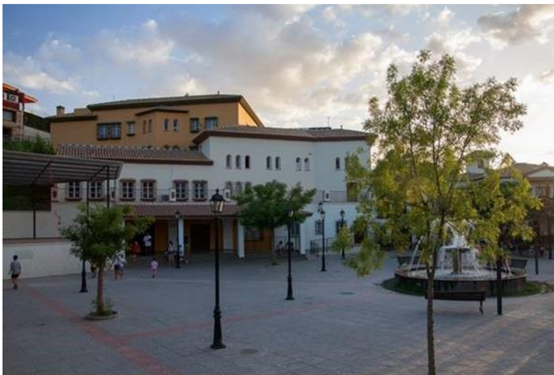
Figure 3. Extérieur de la Maison de la Culture Monachil, siège des 41èmes Rencontres du GEEFSM.