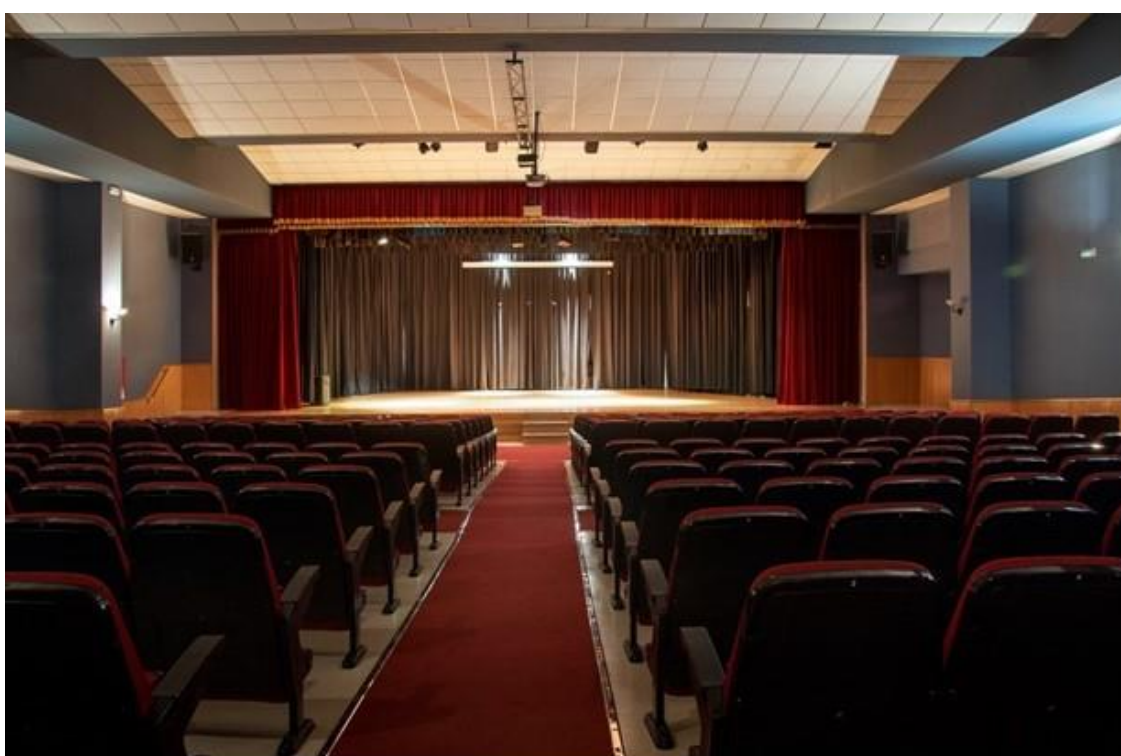
Figure 4. Salle principale de la Maison de la Culture Monachil, siège des 41èmes Rencontres du GEEFSM.

La séance de travail du matin du samedi 9 novembre 2024 aura lieu au Palais des Expositions de Grenade, à l'occasion du IIème Congrès International de la Montagne.